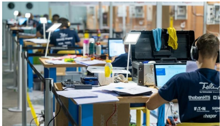
Teilnehmende der Schweizermeisterschaft 2020 bei der Arbeit.

Die zwei Qualifikant*innen für die SwissSkills werden im August und September zu Trainings ins EAZ eingeladen und von Experten gezielt und individuell auf die SwissSkills vorbereitet. Dabei dürfen wir unter anderem auf Fachpersonen zählen, die Berufsmeisterschaften aus eigener Erfahrung kennen.